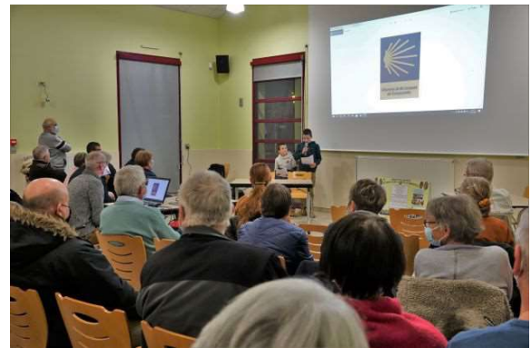
Un aperçu des nombreuses présences à la soirée témoignages du 19 novembre