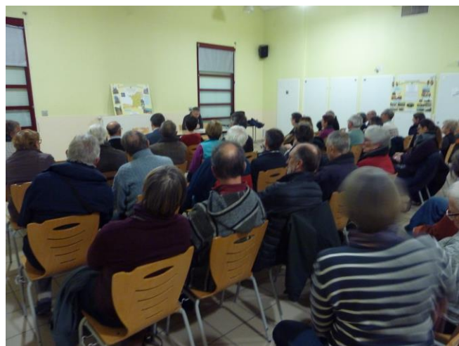
Photos de précédentes soirées témoignages