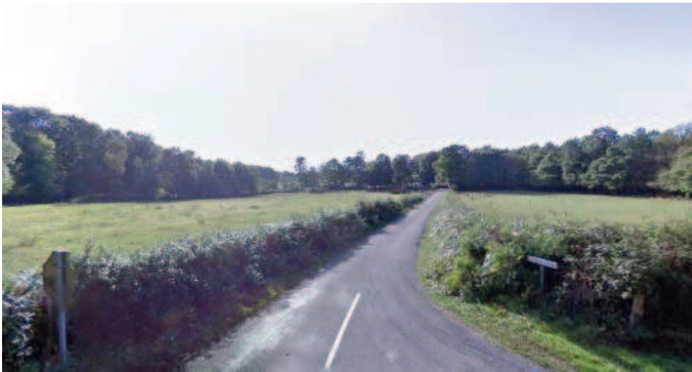
route menant à Saint-pierre-sur-Orthe

Sur la carte au niveau de la parcelle 217 on peut emprunter un chemin forestier qui évite le passage sur la D35 (250m)